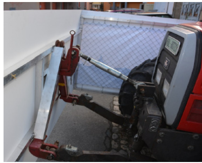
Die neu heeeverstellbari Halterig vo der Draggdoor-Verschaalig - aifach & genial.

Am Fasnachts-Mittwuch hän sich d'JOKER WAGGIS denn nomol am