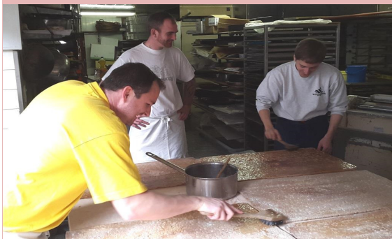
JOKER WAGGIS leege sich ordentlich ins Ziig fir d'Läggerli

Allewyl zwai Wuche vor der Fasnacht isch es sowyt - der jeerlig Läggerli-Samschtig stoot aa!